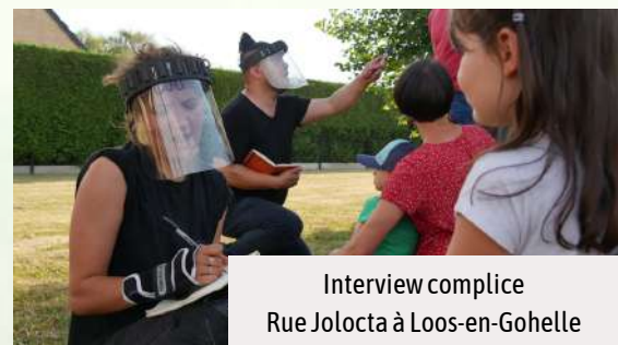
Interview complice Rue Jolocla à Loos-en-Gohelle

Au fur et à mesure des rencontres, nous communiquons sur son existence sur les réseaux sociaux, il est aussi disponible sur le site internet à l'adresse : https://www.crisdelaube.fr/carnets-de-quartier et visible à différents endroits du quartier et affiché chaque jour (quartier général, panneaux d'affichages, halls d'immeubles...).