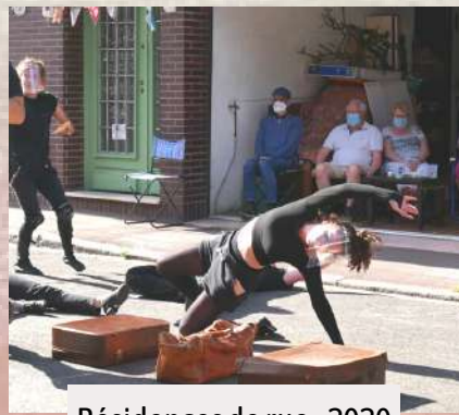
Résidences de rue - 2020