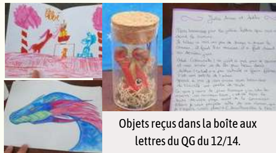
Objets reçus dans la boîte aux lettres du QG du 12/14.

Au-delà des rencontres avec les habitant-e-s, le Collectif mène un travail photographique et/ou vidéo et un travail d'écriture. Pensé comme un journal de bord de création, le "carnet de quartier" nous permet de rendre compte visuellement et poétiquement de notre présence. Les images produites offrent une vision décalée du quotidien et tentent de raconter différemment les espaces connus.